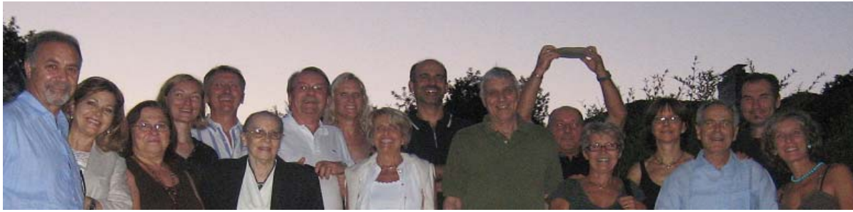
I partecipanti, cocktail, conversazione, cena